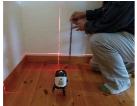
「床の傾きを計測する」調査機器