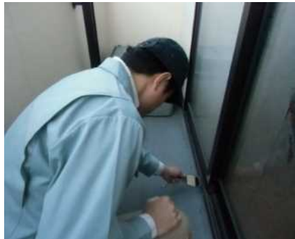
「外部（バルコニー）」調査の様子