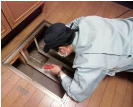
「土台・床組、基礎」調査の様子