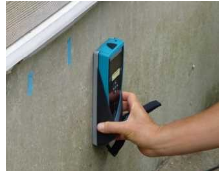
「基礎配筋」の調査機器