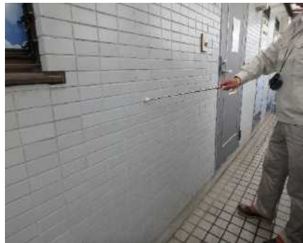
「外部（外壁）」調査の様子