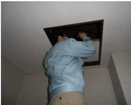
「小屋組・梁」調査の様子